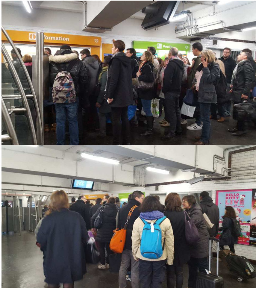
Fonctionnement fréquemment réduit à un seul portillon !